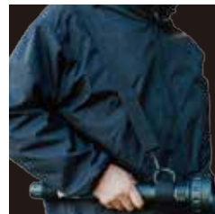
ショルダーストラップ付属