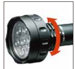
ロータリースイッチ搭載