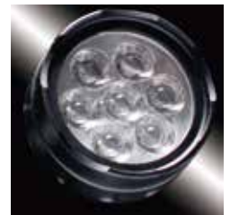
高輝度白色LED×7灯搭載